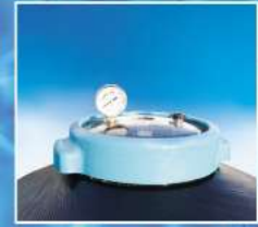
Kolay açılır vidalı-şeffaf kapak