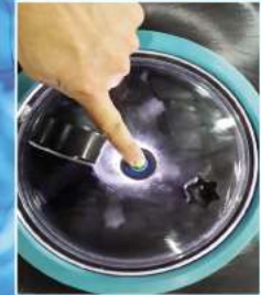
LED aydınlatmalı şeffaf kapak (Opsiyonel)