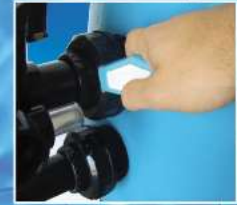
Ø 50 küresel vana sapı ile uyumlu bağlantı rakoru