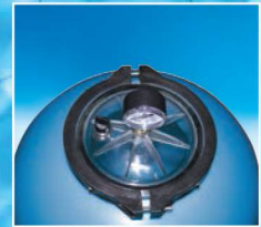
Kelepçeli şeffaf kapak (Opsiyonel)