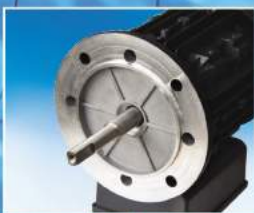
Paslanmaz çelik motor mili