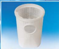
Geniş hacimli sepet