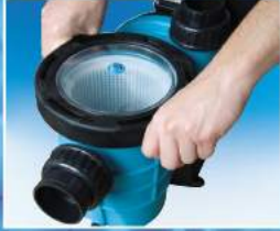
Kolay açılır kapak