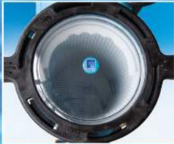
Ön filtre kapağında geniş ve net görünüm

GEMAŞ "STREAMER 2010" kendinden emişli, monoblok ön filtreli, termoplastik gövdeli havuz pompası. Emme ve basma ağzları kendinden rakorlu; 1 1/2 HP ve üstü kapasitelerde 2" (Ø 63 mm), küçük kapasitelerde 1 1/2" (Ø 50 mm). Pompa mili paslanmaz çelik. 40°'lik döndürme hareketi ile kolay açılıp kapanan kapak. Çatlamalara karşı kimyasal dayanımı yüksek şeffaf "Xylex" kapak seçeneği. Benzerlerinden çok daha geniş 4,5 l önfiltre sepeti. IP55 motor. Pompa bağlantı rakorları Ø 50 mm Gemaş Küresel Vana Sapı yardımıyla sıkılıp, açılabilir.