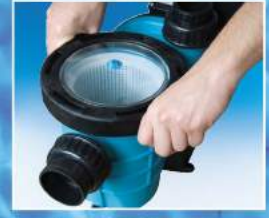
Kolay açılır kapak