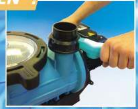
Kendinden rakorlu olup, Ø 50 mm Gemaş Küresel Vana Sapı yardımıyla sıkılıp, açılabilir.