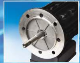
Paslanmaz çelik motor mili